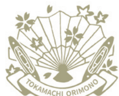
十日町紬/十日町明石ちぢみ