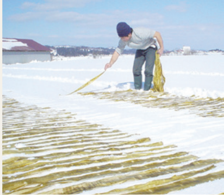
※雪国新潟の気候を利用した雪晒しによる漂白も、一部の地域で行われています

私たち越後の紙屋は、昔ながらの手法を使い、 自然と人の手の温もりを感じる和紙文化を伝承しています。