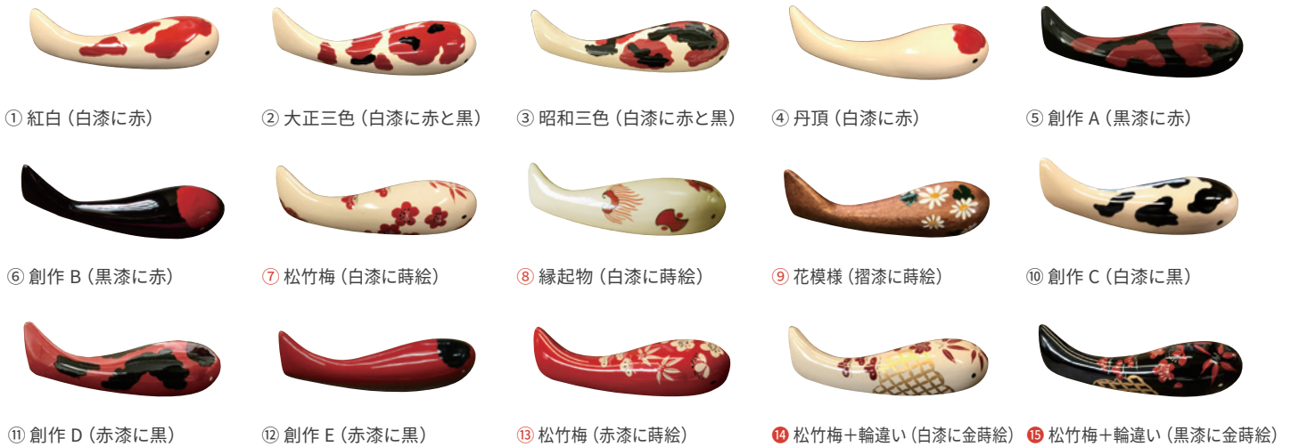
① 紅白 (白漆に赤) ② 大正三色 (白漆に赤と黒) ③ 昭和三色 (白漆に赤と黒) ④ 丹頂 (白漆に赤) ⑤ 創作 A (黒漆に赤) ⑥ 創作 B (黒漆に赤) ⑦ 松竹梅 (白漆に蒔絵) ⑧ 縁起物 (白漆に蒔絵) ⑨ 花模様 (摺漆に蒔絵) ⑩ 創作 C (白漆に黒) ⑪ 創作 D (赤漆に黒) ⑫ 創作 E (赤漆に黒) ⑬ 松竹梅 (赤漆に蒔絵) ⑭ 松竹梅+輪違ひ (白漆に金蒔絵) ⑮ 松竹梅+輪違ひ (黒漆に金蒔絵)