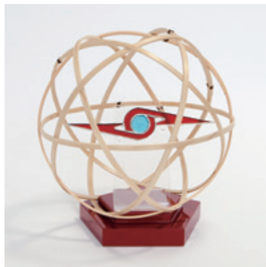
足立さん渾身のウルトラセブンシリーズ第三弾