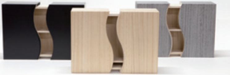
黒・クリア(木地)・グレー(焼桐) ベーシックな3色展開で、どんなインテリアにもフィットします。