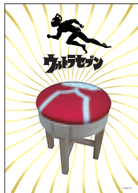
ウルトラセブン放送開始50年記念 円谷プロ公認商品の数々