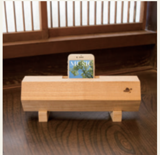
桐エコスピーカーは木地、焼桐仕上(茶)、焼桐とのこ仕上(グレー)の3種類