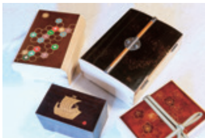
新潟玉手箱 (新潟仏壇×加茂桐箆筒) 新潟仏壇組合所属の塗師・金具師・蒔絵師の皆さん